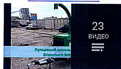
Прицепные измельчители Green Mech

Стоимость измельчителя: ( Пять миллионов семьсот сорок тысяч рублей ) в т.ч.НДС 20%